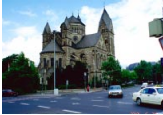
Kobrenz/Allmagne コブレンツ/ドイツ