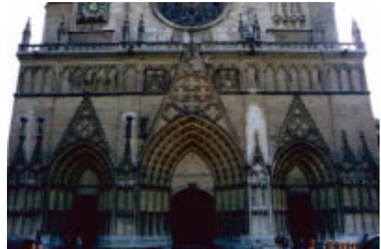
彫刻公開制作参加 : Ecouche / ノルマンディー地方 2000.8.12-8.27