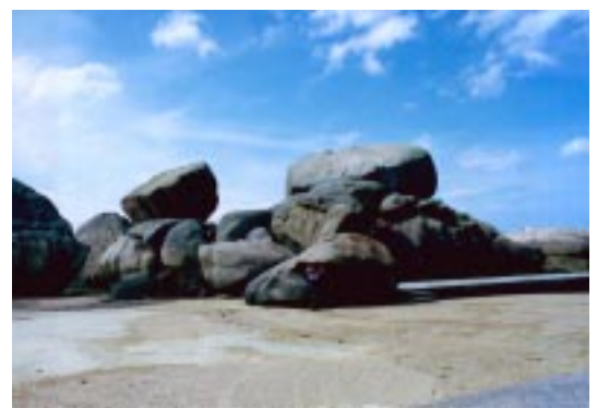
バラ色花崗岩海岸