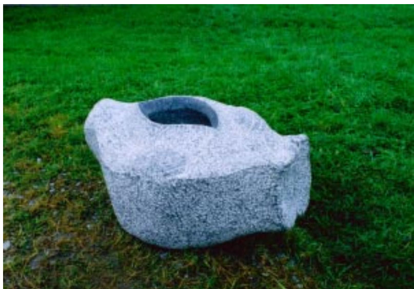
L'éternel féminin :126x77x57 永遠の女性性