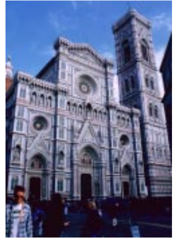
Firenze/Italia フィレンツェ/イタリア

その他：パリ市内、パリ近郊 Sauxy-公園、 シエナ近郊 Rapolano Terme ラボラーノテルメ など