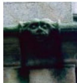
Guingamp ガンギャン 黒マリア...