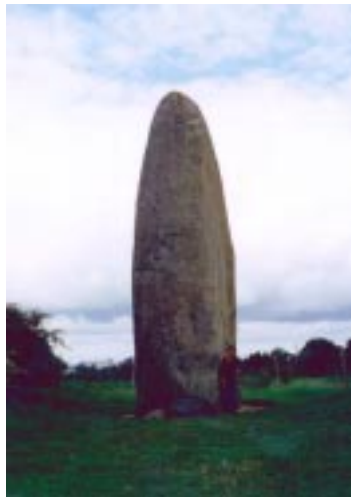
menhir メンヒルとその改宗型