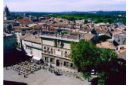
Avignon アビニオン : La Beauté 展等