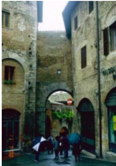
St. Gimignano サンジミニャーノ