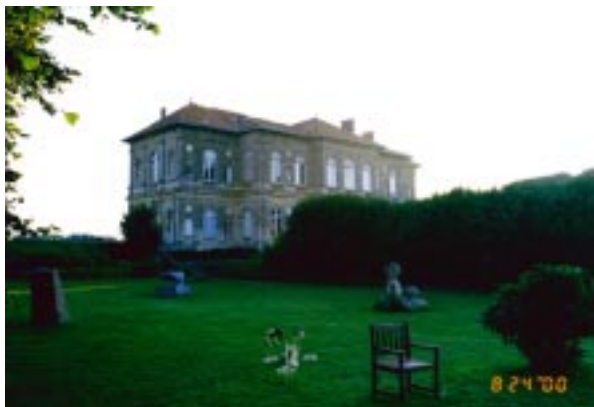
Château de Seran Atelier Balias