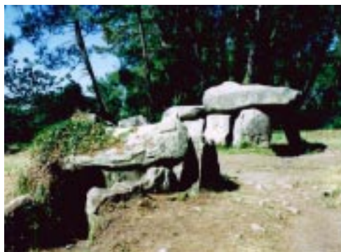
巨石群・Dolmen ドルメン...