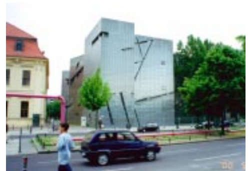
Jewish Museum/Berlin ユダヤ博物館/ベルリン