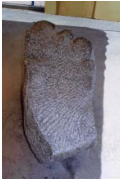
La memoire court avec les nuages (記憶を雲にのせて) 灰・青御影石