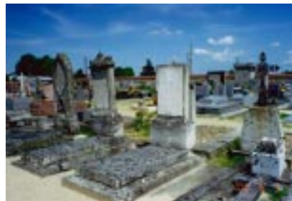
Ouver sur Oise オーベルシュルオワーズ Vincent Van Gogh 最後の地