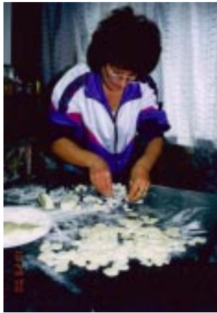
Sardegna 再訪 パスタ作り