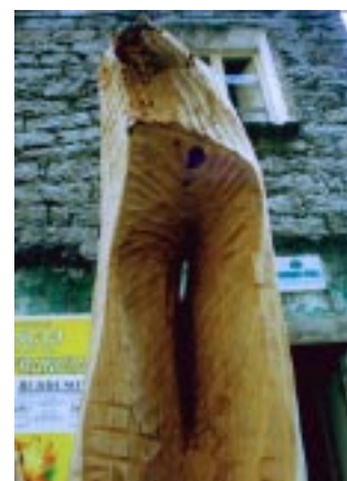
Il vento della memoria per il futuro 記憶の風を未来に