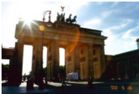
Brandenburger Tor/Berlin ブランデンブルグ門/ベルリン