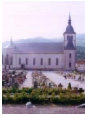
La Bresse ラ・ブレス