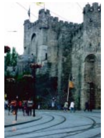
その他 : Epernay, Bruxelles