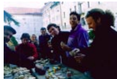
Belluno ベルーン：イタリア北部ドロミテ渓谷ふもと 木彫シンポジウム見学